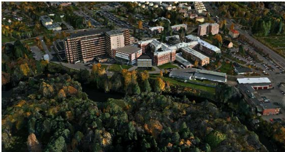
Möjlig vy över nytt patienthotell